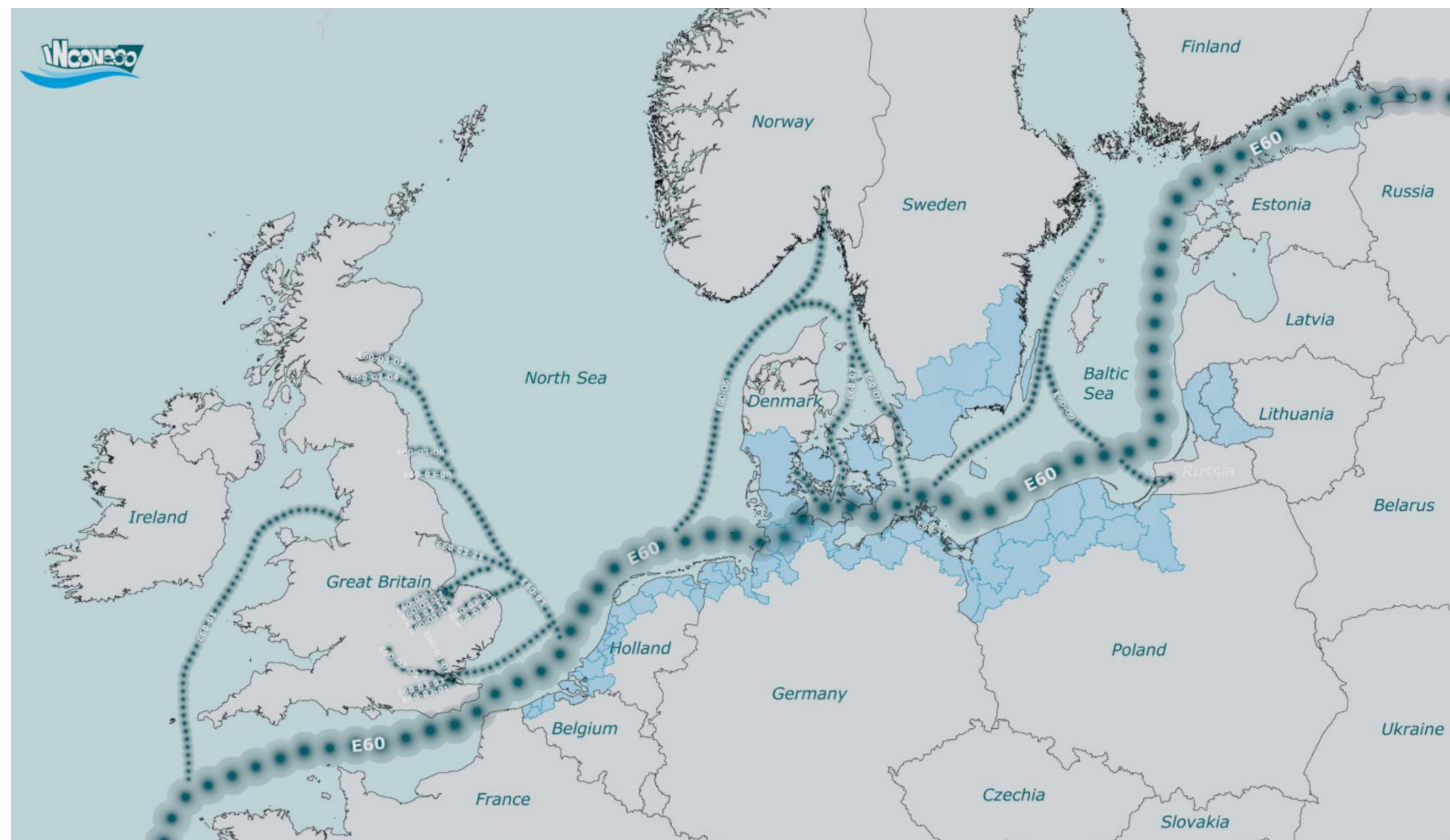
1 pav. Pakrantės maršrutas E60

Jūros pakrančių laivybos maršrutas E60 yra įtrauktas į Europos susitarimą dėl svarbiausių tarptautinės reikšmės vidaus vandens kelių (AGN) – tai Europos vidaus vandens kelių tinklo dalis, kuri šiuo metu yra nenaudojama.